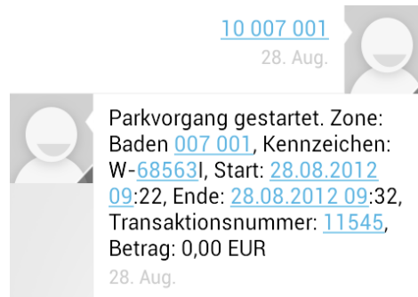
Abb. 1 – ohne KFZ-Kennzeicheneingabe (Beispiel Baden/Wien)